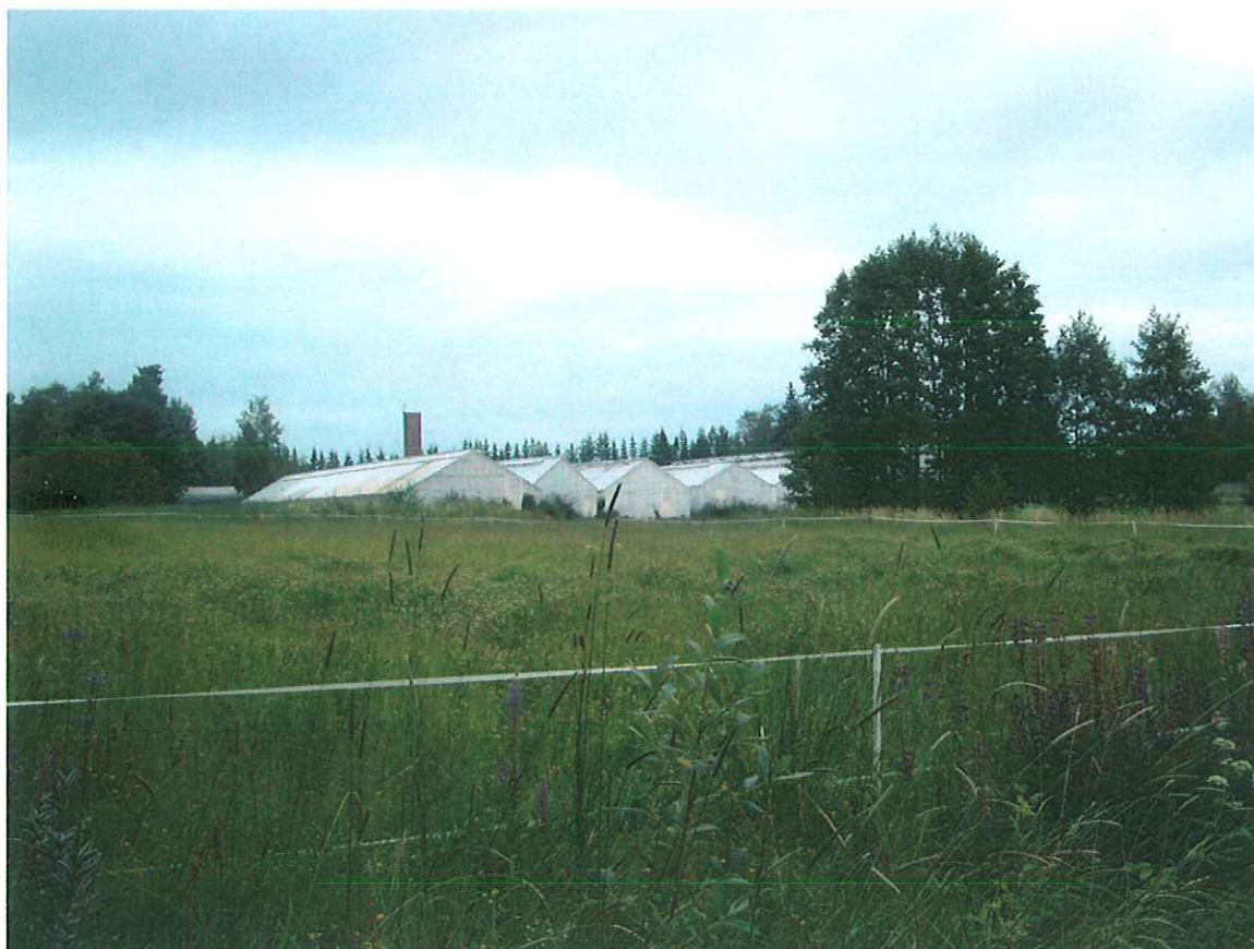
foto från södra delen av Ekängen med drivhusen i bakgrunden.