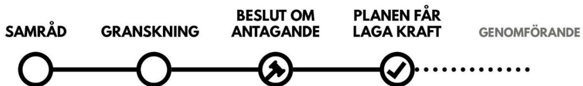
Figur 1 Standardförfarande

Detaljplanen handläggs med standardförfarande enligt PBL, se figur 1 nedan. Förfarandet har valts med hänsyn till att planförslaget är förenligt med kommunens gällande översiktsplan, inte förväntas medföra betydande miljöpåverkan eller vara av betydande intresse för allmänheten. Planarbetet sker i en process där berörda får möjlighet att lämna synpunkter på planförslaget.